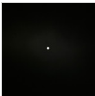
Moon. Un punto fermo nel cielo. Andrea Calabresi

In Moon la Luna è immortalata nella sua fissità, nel suo essere ancora nella mutevolezza del cielo, dove le nuvole paiono rincorrersi l'un l'altra creando un movimento persistente che contrasta con il suo essere saldo punto luminoso, vivido e rassicurante.